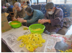
菊ちらしは慣れたもの

今年も残り一月とわずかです。十一月を迎えました。寒さが身にしてみえました。さて、十月の笑和感ですが、年に一度の大イベントの秋祭りが、笑和感で行われました。今年も、私や代表も出演しての舞踊ショーや、美味しい芋煮や手作りの各種料理がテーブルに並び、皆さん、お腹いっぱい堪能されていました。秋は食べるもの全てが美味しいので、つつい食べ過ぎてしまいます。