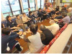
中学生と一緒に体操